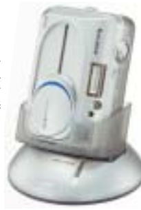
With optional PictureCradle

選購PictureCradle傳輸機座，有效分離並提供簡單且流行的方法，自動傳送影像到您的電腦上，同時也對您的相機電池充電，PictureCradle包含AC變壓器與充電電池。