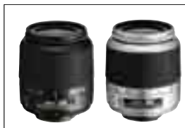
全新推出 AF-S DX 變焦尼爾爾 18-55mm f/3.5-5.6G ED

支援尼康全面的影像系統, 包括選擇眾多的優質尼爾爾鏡頭, 以及支援尼康創意閃光系統的 SB-800 或 SB-600 閃光燈。