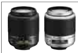
全新推出 AF-S DX 變焦尼爾爾 55-200mm f/4-5.6G ED