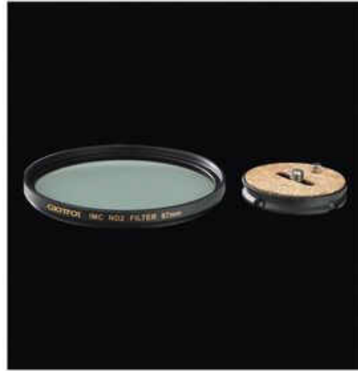
超薄快裝板只有 8.7mm 厚度 (VGR 專利超薄雲台與濾鏡之比較圖)