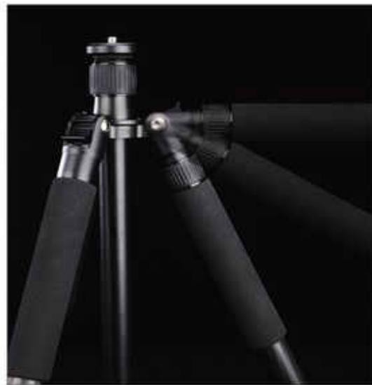
按動快速松開鎖扣可調節支架展開角度, 並支持每一支架展開三種不同角度。