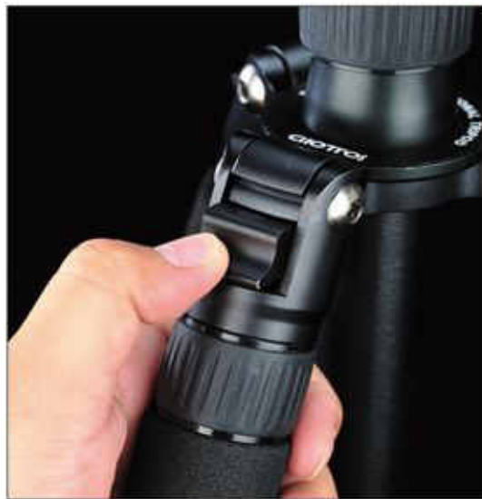
專利三段式腳架調節按鈕。