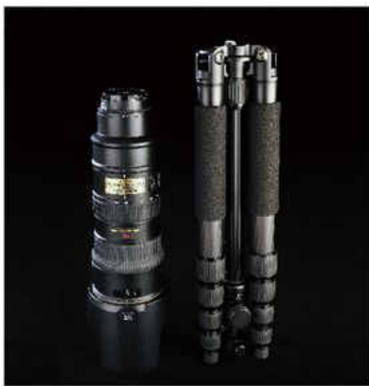
反折後收藏體積, 幾乎同等70-200mm F2.8鏡頭大小。