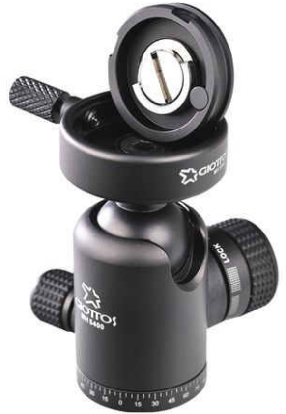
新型超薄 8.7mm 快裝板, 均搭配快鎖式兩用相機螺絲.