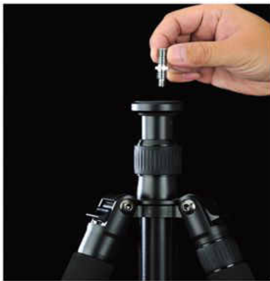
快速更換 1/4" 與 3/8" 相機螺絲。