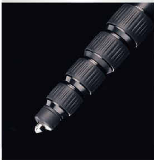
專利隱藏腳針式橡膠腳墊。 (8254/9254/8264/9264)