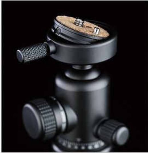
專利超薄型快裝板, 具有雙孔90度快帶定位裝置.