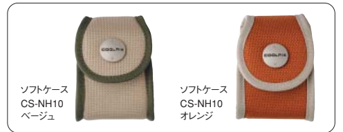
ソフトケース CS-NH10 ベージュ